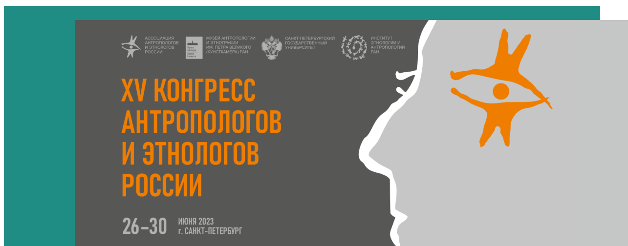
Афиша XV Конгресса антропологов и этнологов России. Санкт-Петербург. 2023 г.