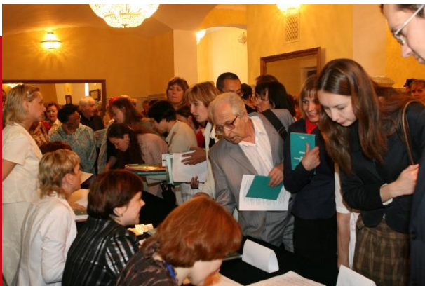
Регистрация участников VII конгресса, Саранск

VII КЭАР работал в Саранске с 9 по 14 июля 2007 г. и рассматривал тему «Многоэтничные общества и государства». Организаторы КЭАР – Ассоциация этнографов и антропологов России, Институт этнологии и антропологии им. Н.Н. Миклухо-Маклая РАН, Правительство Республики Мордовия, Научно-исследовательский институт гуманитарных наук при Правительстве Республики Мордовия. Финансовую поддержку оказали РГНФ, Глава Республики Мордовия Н.И. Меркушкин и Правительство Республики Мордовия. В рамках VII конгресса было представлено 43 тематических направления, очное и заочное участие в форуме приняли 1 219 человек из 90 российских городов и 28 зарубежных стран.