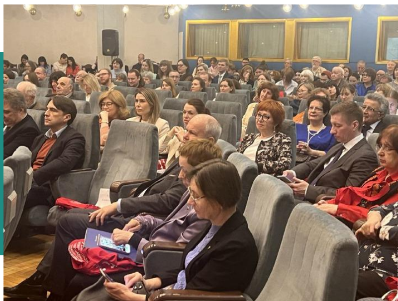
Коллектив Института этнологии и антропологии РАН

В рамках X Международного интердисциплинарного научно-практического симпозиума медицинских антропологов (ноябрь 2022 г.) прошли два круглых стола – «Передача медицинских знаний в локальных сообществах Индии: проблематика и перспективы» (основные доклады сделали представители Департамента антропологии университета г. Майсура, специализирующегося на изучении племенных культур Индии) и «Традиционные медицины Индии (в рамках министерства AYUSH) – современная практика применения и особенности распространения» (участвовали медицинские антропологии Университета г. Дели; Университета Аллахабада, Праяградж; практикующие специалисты Аюрведического колледжа Шри Дхармастхала Манджунатешвара, Хассан, Карнатака и др.).