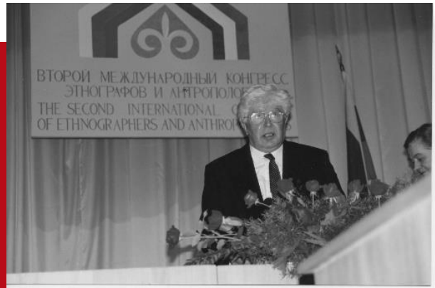
Участники II Конгресса этнографов и этнологов России