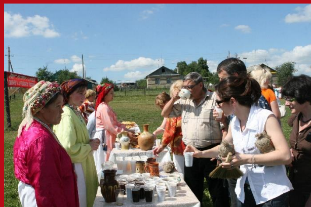
Культурная программа VII Конгресс, Саранск