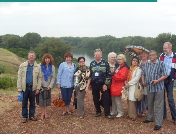
Участники и волонтеры VIII Конгресса этнографов и антропологов России, Оренбург, 2009 г.

С тезисами докладов конгресса можно ознакомиться по ссылке: http://www.osu.ru/sites/niisu/docskongress.pdf