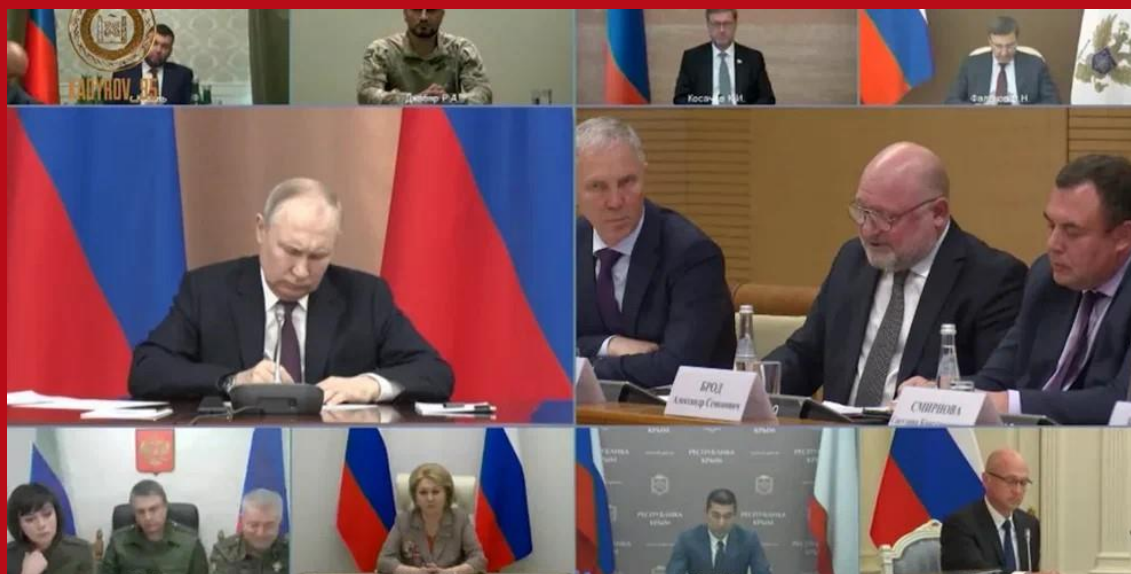
Заседание Совета при Президенте Российской Федерации по международным отношениям. Пятигорск, 19.05.2023

19 мая 2023 г. в Пятигорске под председательством Президента Российской Федерации В.В. Путина по видеосвязи состоялось заседание Совета при Президенте Российской Федерации по международным отношениям. Основные вопросы встречи – преимущества современной российской модели государственной национальной политики, интеграция новых регионов в российское социокультурное пространство и корректировка Стратегии государственной национальной политики в условиях внешних вызовов и угроз.