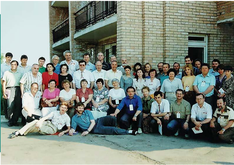
Участники I Конгресса этнографов и антропологов России. Рязань, 1995 г.

С некоторыми докладами I КАЭР можно ознакомиться по ссылке: https://istina.msu.ru/conferences/3950896/