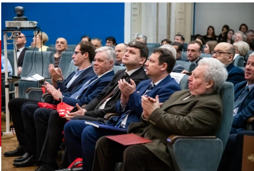
Торжественное заседание, посвященное 90-летию Института этнологии и антропологии им. Н.Н. Миклухо-Маклая РАН

верной Осетии. В ходе исследования было опрошено 650 респондентов. Результаты этносоциологического исследования показывают, что среди жителей республики доминируют позитивные установки на сохранение этнического и культурного своеобразия региона в составе Российской Федерации, поддержание и развитие мирных отношений среди представителей разных этнических групп. При достаточно сильной региональной идентичности, для большей части респондентов очень важны чувство общероссийского гражданского единства и связь со всей страной.