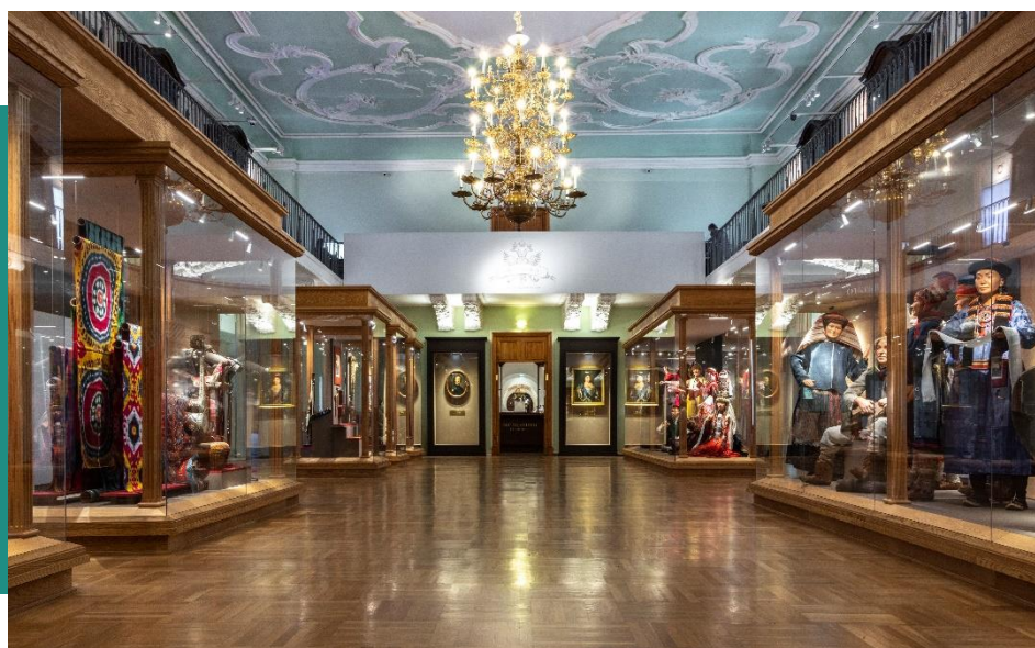
Экспозиция «Имперский зал. Многонародная Россия» МАЭ РАН

«Петровская Кунсткамера, или Башня знаний» – подарок отцу-основателю и возвращение в стены исторического здания атмосферы раннего универсального музея.