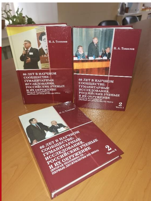
Публикации омских этнографов

этнические, демографические, социальные, хозяйственные особенности населения; проанализированы взаимоотношения коренного и пришлого населения в условиях внедрения имперских правовых и хозяйственных норм; изучен делопроизводственный язык Петровской эпохи и выявлены региональные языковые особенности.