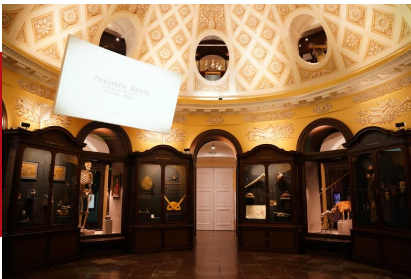
Экспозиция «Петровская Кунсткамера или Башня знаний» МАЭ РАН