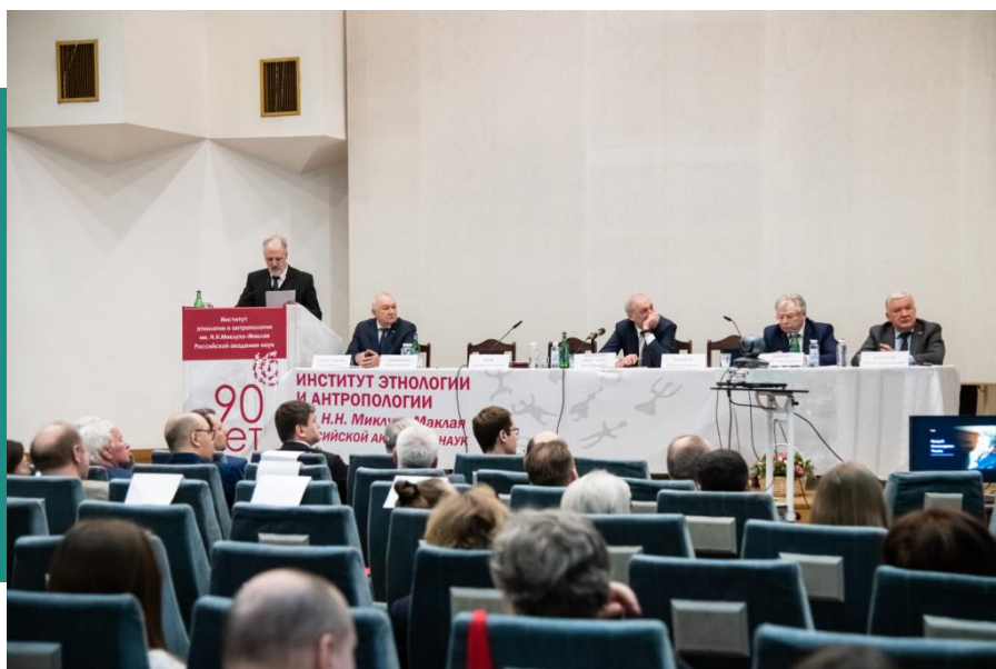
Торжественное заседание, посвященное 90-летию Института этнологии и антропологии им. Н.Н. Миклухо-Маклая РАН