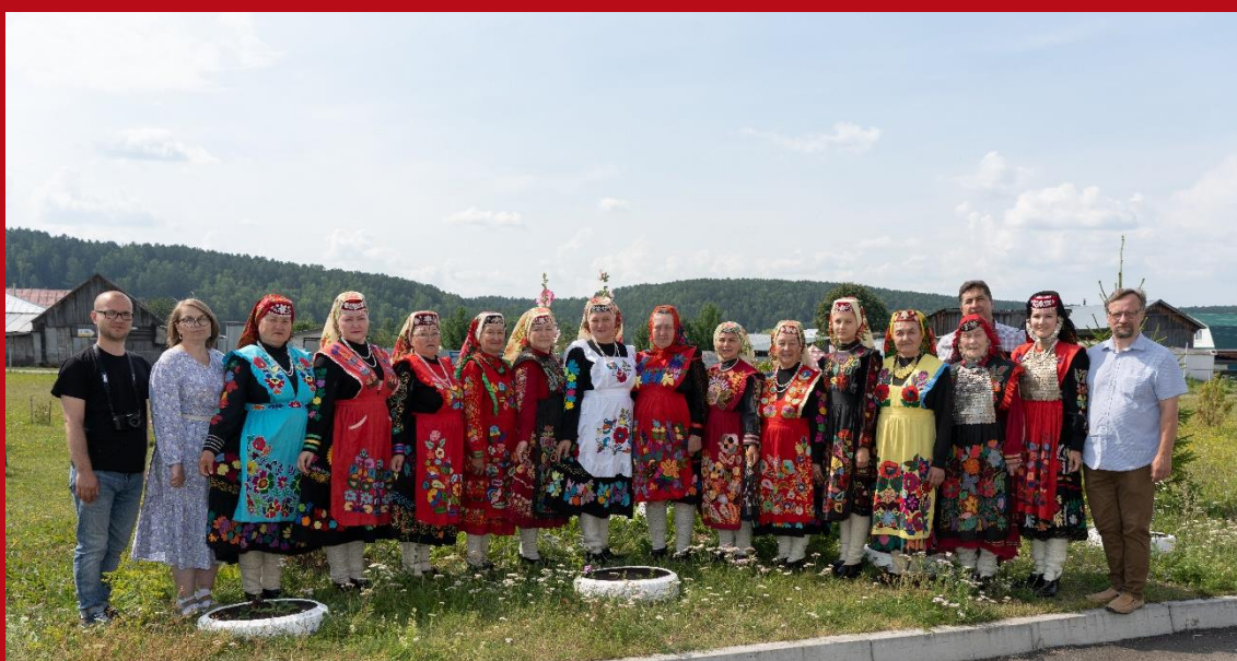
Во время полевого исследования в деревне Аракаево Нижнесергинского района Свердловской области. 2022 г.

десяти полевых экспедиционных исследований в регионах России по выявлению и изучению объектов нематериального культурного наследия народов России (Пермский край, Свердловская область, Челябинская область, Калининградская область, Республика Марий Эл, Республика Татарстан и др.). Материалы экспедиций размещены в федеральном каталоге объектов нематериального культурного наследия народов России. Проект не только позволил сохранить значительный пласт нематериального культурного наследия, но и позволил сформулировать общие проблемы и задачи работы научного сообщества в этом направлении в части разработки методики архивирования материалов, использования ресурсов государственных музейных и архивных учреждений. В 2023 г. коллектив института получил поддержку на изучение нематериального культурного наследия в рамках Программы научных исследований и прикладных работ, связанных с изучением этнокультурного многообразия российского общества и направленных на укрепление общероссийской идентичности.