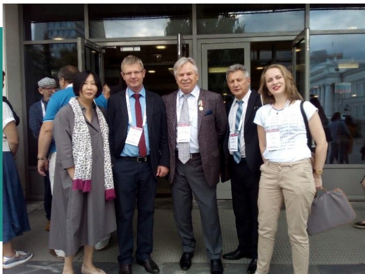
Участники XIII Конгресса антропологов и этнологов России. Казань, 2019 г.