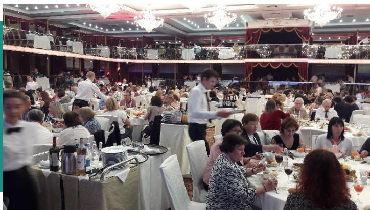
Участники XIII Конгресса антропологов и этнологов России. Казань, 2019 г.

С материалами Казанского конгресса можно ознакомиться по ссылке: