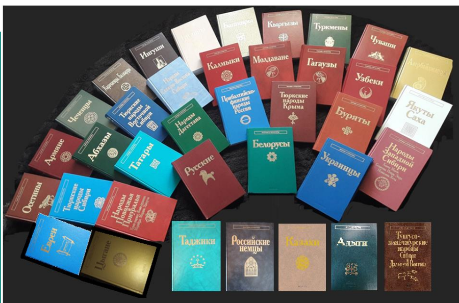
Все книги серии «Народы и культуры»

Важно, что академические тома – коллективные монографии – написаны с использованием именно научного понятийного аппарата, при этом выдержаны в таком стиле изложения, который доступен для восприятия самых разных социальных слоев. Поэтому они пользуются большой популярностью в широкой читательской среде, включая многочисленные национальные общества и учащиеся в различных сферах и уровнях образовательной системы. Серия томов призывает к расовой, этнической и религиозной терпимости, толерантному восприятию многообразной культуры и обычаев различных народов. О научной и общественной значимости серии «Народы и культуры» говорят издания повторных тиражей многих томов и государственные награды. Например, том «Татары» был удостоен Государственной премии Республики Татарстан. В 2005 и 2007 гг. на III и IV Международных книжной и полиграфической ярмарках «По Великому шелковому пути» в Республике Казахстан Диплом победителя в номинации «Лучшая издательская серия. Научно-познавательная литература» был вручен «за книжную серию «Народы и культуры».